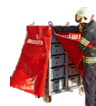
Schutzhülle mit Zippverschluss