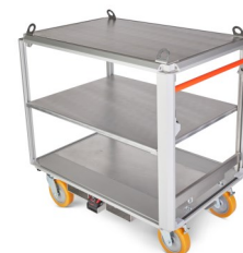
Aluminium Deckelblech und Fachböden