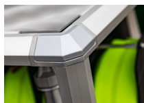
Designabdeckkappen für Eckverbinder