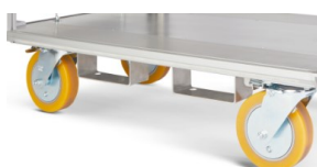
Aufnahme für Transport mit Stapler