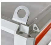
Kranösen für Rahmen- und Plateausausführung