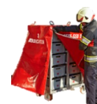
Schutzhülle mit Zippverschluss