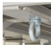
Zugöse für Verlastung mit einer Seilwinde