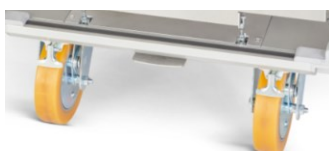
Geradauslaufeststeller für Lenkrollen